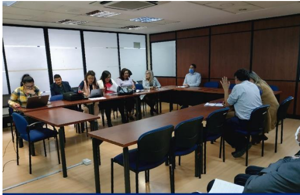
MESA DE ASESORES ORDENAMIENTO TERRITORIAL | 08 - 02 - 2023