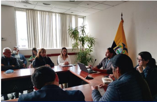
REUNIÓN DE TRABAJO MINISTERIO DEL AMBIENTE | 22 - 11 - 2022