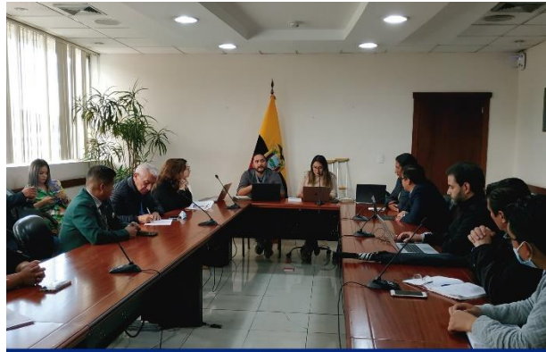
REUNIÓN DE TRABAJO MINISTERIO DEL AMBIENTE | 22 - 11 - 2022