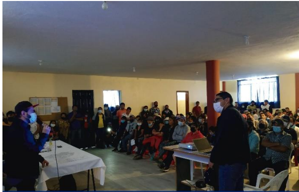
MESA DE TRABAJO ASENTAMIENTO EUCALIPTOS DE CALDERÓN | 16 - 10 - 2022