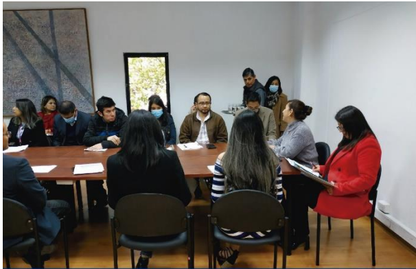
MESA DE TRABAJO DESBLOQUEO CATASTRAL | 14 - 03 - 2023