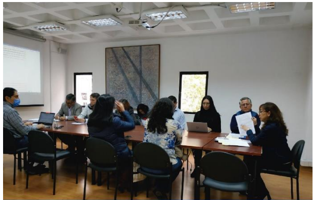
MESA DE TRABAJO, ORDENANZA MULTAS E HIPOTECAS | 09 - 03 - 2023