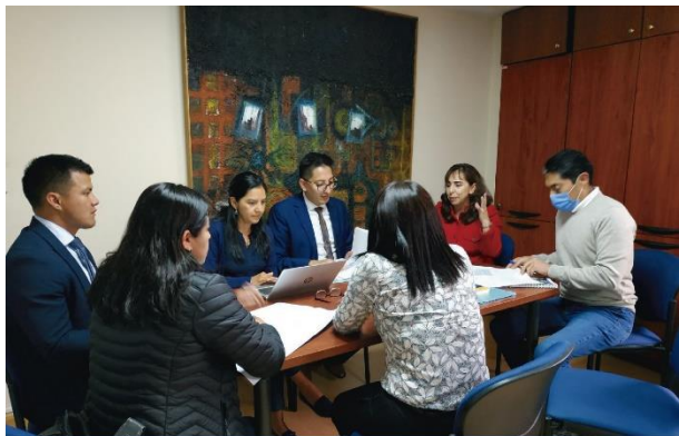
MESA DE TRABAJO SECRETARÍA DE CONCEJO Y UERB | 27 - 02 - 2023