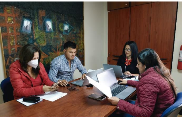
COMISIÓN DE ORDENAMIENTO TERRITORIAL, REGULA TU BARRIO | 06 - 01 - 2023