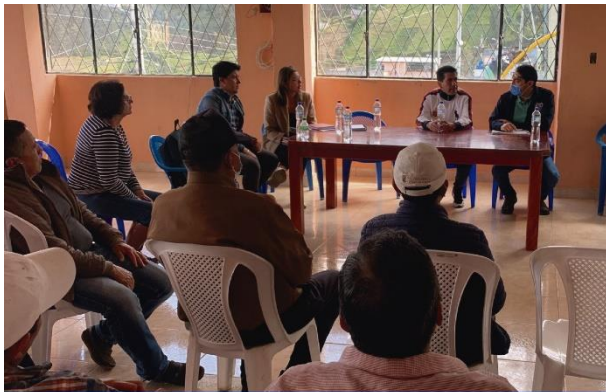
MESA DE TRABAJO, BARRIO COORDILLERA DE COTOCOLLAO | 17 - 02 - 2023