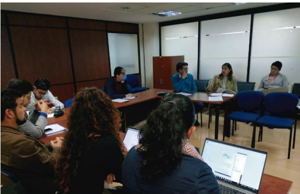
MESA DE ASESORES ORDENAMIENTO TERRITORIAL | 22 - 02 - 2023