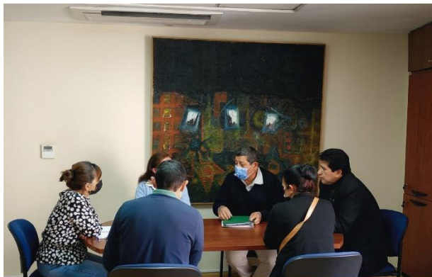
MESA DE TRABAJO, BARRIO COORDINADORA DE COTOCOLLAO | 27 - 01 - 2023